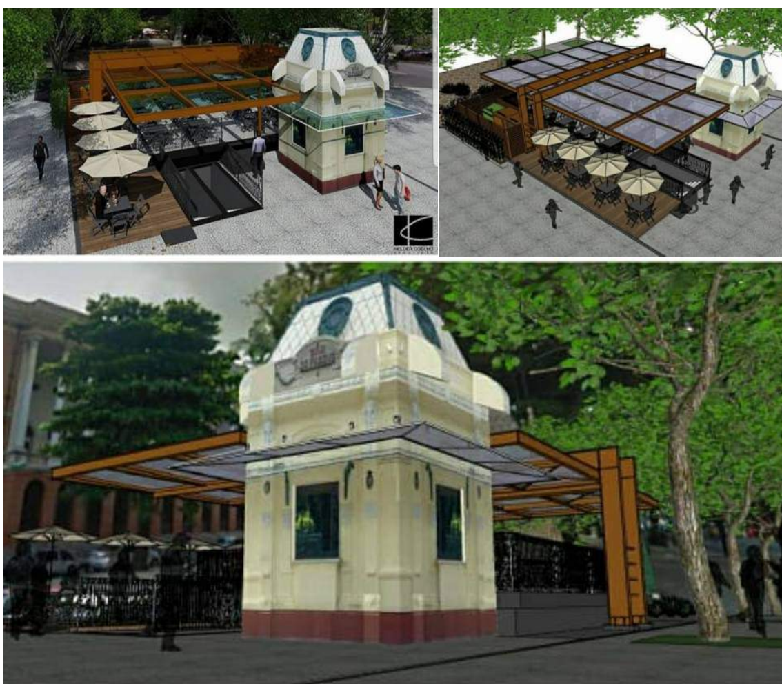
Figura 03 – As primeiras imagens do projeto de remodelagem do Bar