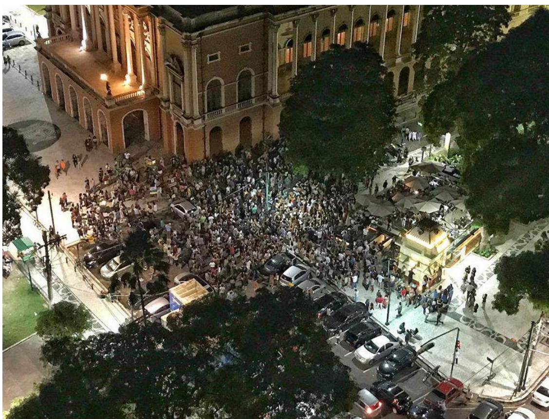
Figura 05 - Batuque na Praça após a reinauguração do Bar