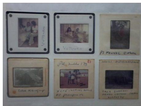
Figura 2 Close de uma ficha que armazena slides diversos.

Esta pesquisa problematiza a própria produção do arquivo, uma vez que se trata da atuação dos pesquisadores, da interação com a pesquisa e com instituições. Mas também quando este arquivo, produzido por outros, a partir de demandas de memória, sai da esfera instrumental do pesquisador para se relacionar a outras demandas, sendo pesquisas acadêmicas ou não. A análise abrange os arquivos etnográficos no sentido que Heymann destaca enquanto acumulação durante o fluxo natural de documentos produzidos e recebidos (Heymann, 2012, p. 65). Problematizar o arquivo, considerando sua trajetória, somando a do colecionador, é uma forma de analisar como a memória, mais estruturante, está então imbricado ao processo. Cada documento é um acontecimento, cada arquivo como um processo a ser analisado. A pesquisa em arquivo comunica uma temporalidade que a Antropologia pode refletir sobre, não apenas como