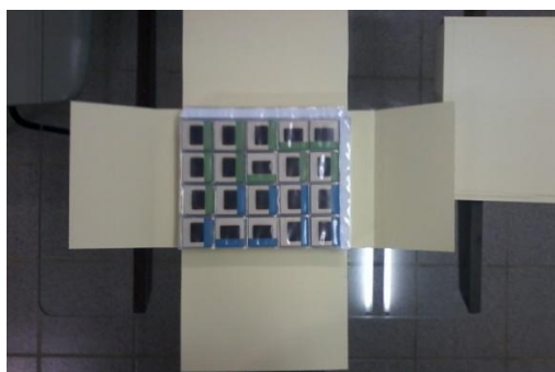
Figura 1 Em caixas de papel neutro, dentro de fichas plásticas que armazenam 20 slides por ficha. Cada caixa guarda 15 fichas.

Em algum momento da sua trajetória enquanto funcionário do MARquE este material foi doado de forma informal, sem dados sobre quantidade de fotografias, informações sobre elas. A situação das fotos em si tenho acompanhado desde 2012 durante a pesquisa de mestrado (Fürbringer, 2013). Atualmente os slides foram higienizados e organizados em caixas e estão para acesso de pesquisadores na seguinte forma: