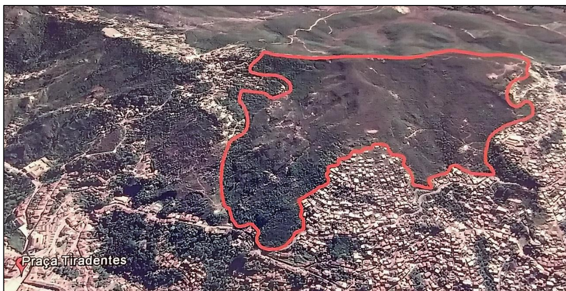
Imagem 1 – Delimitação do Sítio Arqueológico Morro da Queimada em relação a Pça Tiradentes, abaixo à esquerda – Ouro Preto – MG – Fonte: Google, elaboração LAPACOM –Museologia - UFOP

encontros e ações de capacitação e mobilização comunitária nos bairros abrangidos pelo Parque, e, como museu de território, não possui sede física, um acervo armazenado ou exposto em determinado espaço, mas trabalha com acervos que são identificados e guardados pela própria população local.