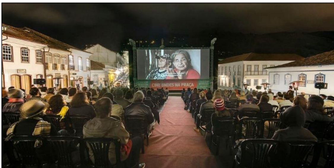
Imagem 2 - Exibição de filme na Mostra CineOP – Pça Tiradentes – Fonte: Universo Produções

Em contraponto, a atual dinâmica urbana de Ouro Preto é bastante agitada e diversificada como toda cidade turística, incluindo a visita diária de centenas de turistas brasileiros e estrangeiros. Ouro Preto recebe ainda cerca de 30 eventos fixos anuais de médio e grande porte, que ocupam espaços públicos e ruas como o Festival de Inverno de Ouro Preto e Mariana, a Mostra de Cinema de Ouro Preto - CINEOP, o Festival Internacional Tudo é Jazz, além de dezenas de festas religiosas e populares, com destaque para a Semana Santa e festas populares como Cavalhadas e o Carnaval de Ouro Preto. Apesar do controle dos órgãos de patrimônio cultural, a cidade sofre urbanisticamente com o tráfego de veículos e o impacto de alguns eventos. Em paralelo, a cidade conta com a UFOP, uma universidade federal estruturada, que possui mais de 12.000 alunos originários de diferentes cidades de Minas Gerais e do Brasil, 50 cursos de graduação, repúblicas estudantis e um campus próprio, este fora da parte tombada da cidade.