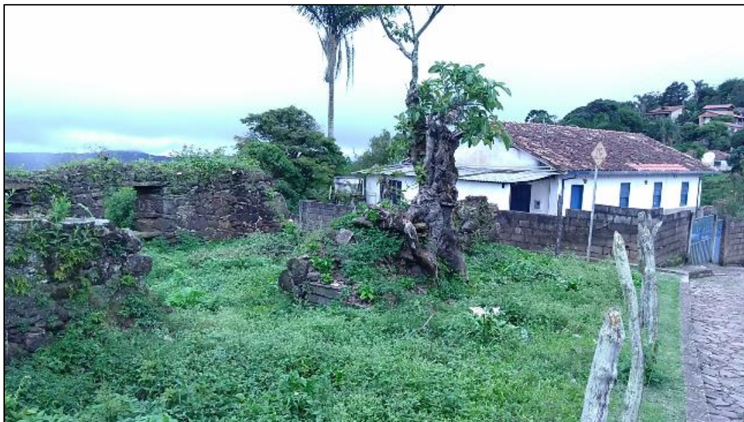
Imagem 4 - Ruína dentro de bairro da Serra de Ouro Preto com casa ao fundo

Considerando que uma parte das ruínas do Parque Arqueológico da Serra da Queimada se localiza dentro de áreas habitadas pela população dos bairros da Serra de Ouro Preto é de fundamental importância reconhecer e valorizar não apenas a dimensão histórica das ruínas, mas a dimensão cotidiana destes espaços para os moradores como lugares de vivência da cidade. Tratam-se de espaços que relacionam seus lugares de moradia ao patrimônio valorizado de Ouro Preto, em contraposição à visão de espaço abandonado e de incompletude denotada a princípio pela ideia de ruína.