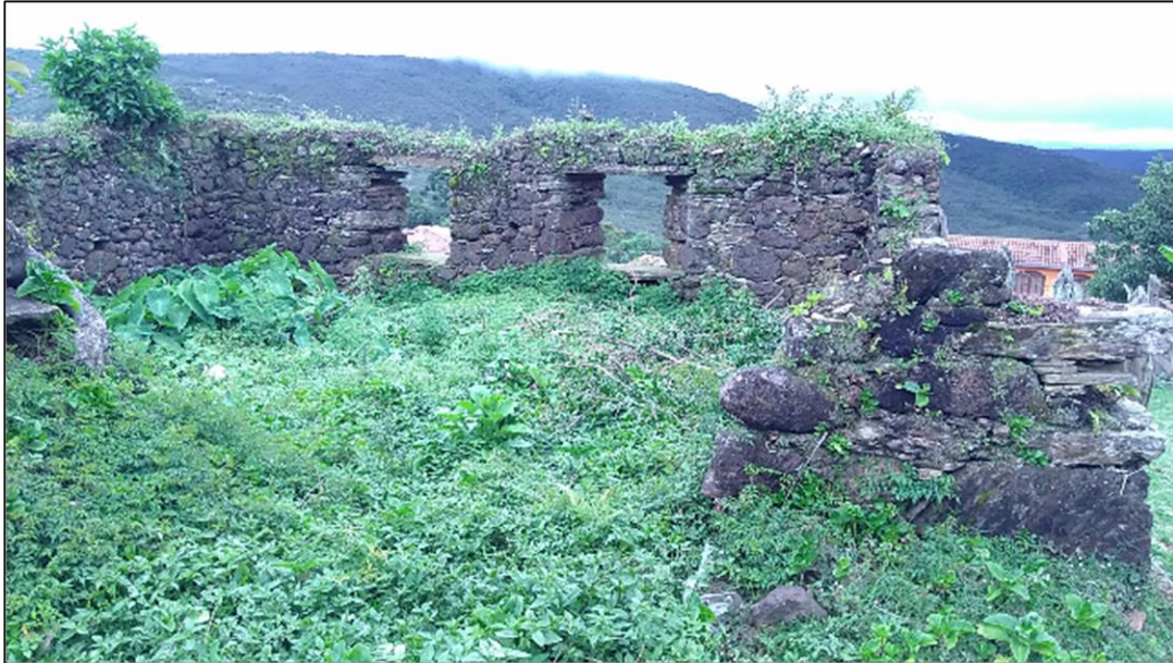
Imagens 5 – Detalhe de ruína dentro de bairro da Serra de Ouro Preto

Desta maneira, ao mesmo tempo em que se apreende processos históricos mais amplos, vislumbrando a cidade de Ouro Preto como uma cidade colonial inserida na vida e dinâmica urbana moderna, é necessário também reconhecer adequadamente as especificidades da cidade sem reificá-las ou superestimar os efeitos dos processos comunitários e museológicos estudados.