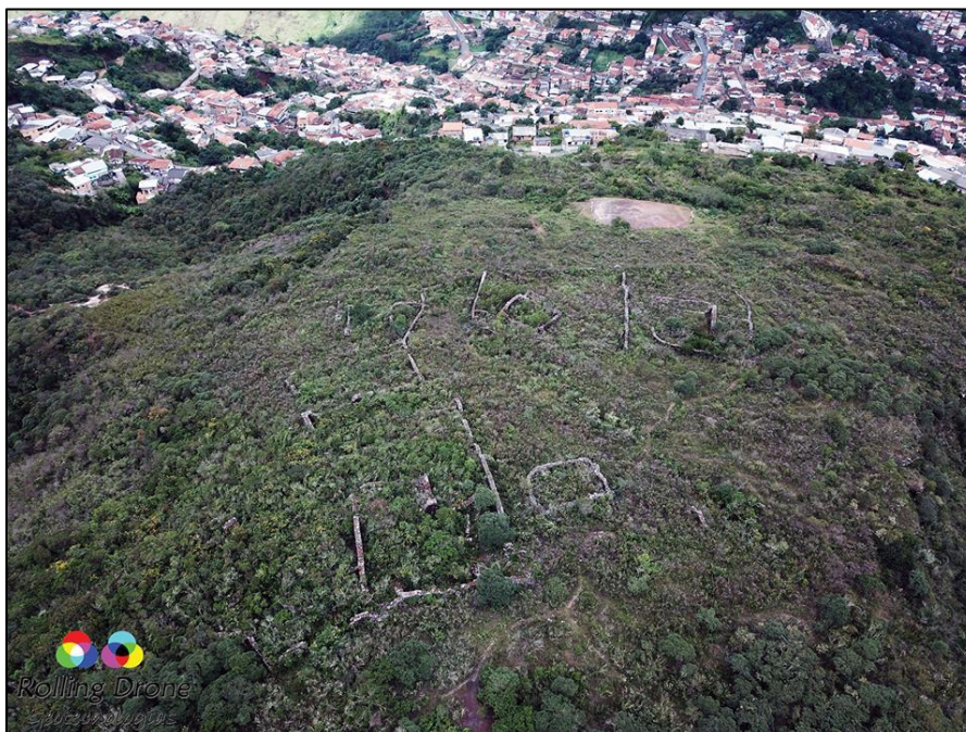
Imagem 2 – Sítio Arqueológico Morro da Queimada em relação aos bairros da Serra de Ouro Preto acima– Ouro Preto – MG – Fonte: LAPACOM – Museologia - UFOP

Os bairros da Serra de Ouro Preto são, desde então, um espaço urbano periférico à cidade monumento de Ouro Preto, cujo reconhecimento como parte integrante da história local está ainda em processo de construção com a criação do Parque Arqueológico do Morro da Queimada, cuja mediação com a população local cabe ao Ecomuseu da Serra de Ouro Preto.