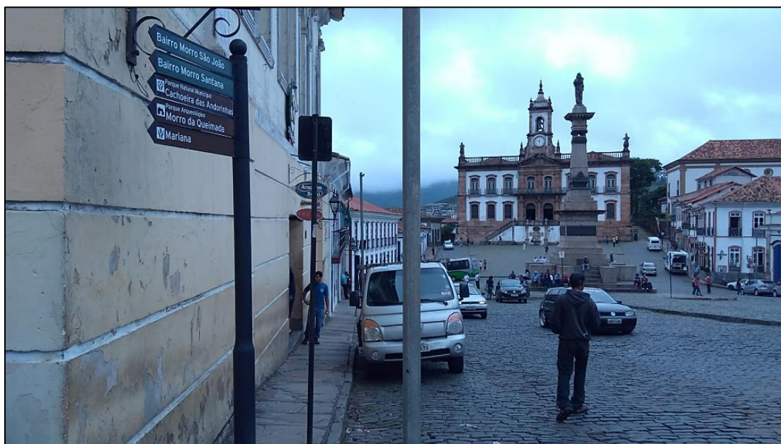
Imagem 3 - Placa turística na entrada de Ouro Preto indica o Parque Arqueológico do Morro da Queimada e os bairros de Morro São João e Morro Santana

A partir disso, podemos questionar: quais as especificidades e decorrências deste suposto modo de vida urbano próprio? Que relações, usos e contra usos sociais são estabelecidas com o patrimônio cultural para vivenciar a cidade de Ouro Preto? Não há respostas simples e imediatas para estas questões, mas será importante perceber ao longo do trabalho de campo como as diferentes dinâmicas, períodos e eventos afetam este suposto modo de vida urbano próprio, cujo o patrimônio cultural é a referência central.