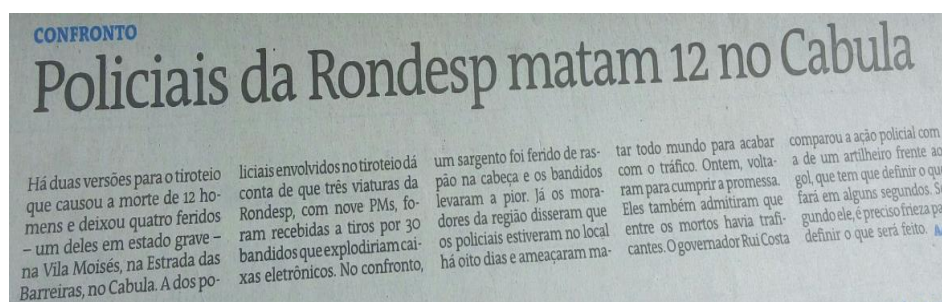
Figura 1. Chamada de capa do Jornal A Tarde em 07/02/15.

Ambos os jornais abrem o noticiário especializado em violências da edição de 7 de fevereiro de 2015, um dia após o evento, com chamadas dedicadas ao acontecimento conforme figuras abaixo. O jornal A Tarde :