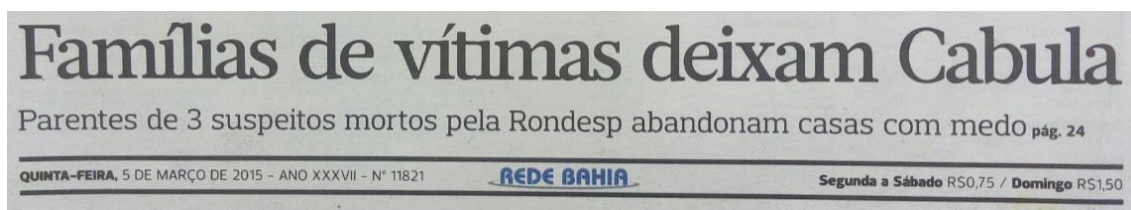
Figura 6. Familiares deixam o Cabula - Jornal O Correio em 05/03/15.

Não obstante as denúncias de intimidação, os moradores da Vila Moisés continuaram a sofrer ameaças da PM e a viver sob um clima de medo, com alguns deles optando por mudar de bairro, conforme publicou o jornal O Correio . Na capa do jornal segue a frase: Famílias de vítimas deixam Cabula: Parentes de 3 suspeitos mortos pela Rondesp abandonam suas casas com medo, conforme figura 6.